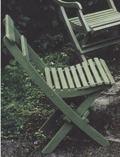
Kuvat 8 ja 9. Perinteiset taittavat tuolit. Muoto ja koko itse määriteltävissä.