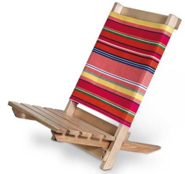
Kuva 2. Simppeli rantatuolimalli