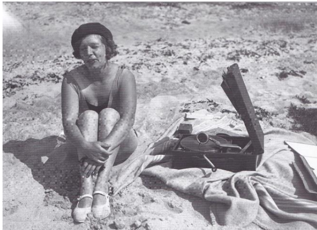
Kuva vuodelta 1929. (Suomalaisen arjen historia 3 : Modernin Suomen synty, 2007)

Tehtävänanto: Tutustu siihen, millaista oli vapaa-aika 1800-luvulta 1900-luvun alkupuolelle. Mitä ihmiset tekivät, missä he olivat ja kenen kanssa. Vertaile, millaisia yhtymäkohtia löydät nykyajan elämään. Tehdäänkö samoja asioita edelleen? Mikä on muuttunut? Pohdi, millaisista vapaa-ajan tilanteista itsellesi on jäänyt parhaita muistoja. Miten sinä haluaisit viettää vapaa-aikaa yhdessä muiden kanssa?