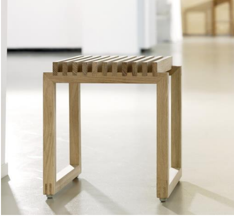
Kuva 1. Helposti pyöräntarakalla kulkeva istuin.